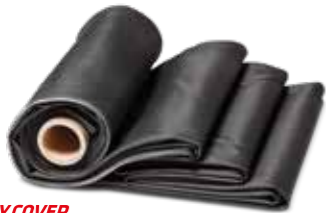
HERTALAN® EASY COVER

HERTALAN® EASY COVER wird ohne offene Flamme verarbeitet, ist wurzelfest, FLL-geprüft sowie gegen UV und Ozon beständig. Das System eignet sich für jedes Flachdach – ob lose verlegt mit Auflast, mechanisch befestigt oder verklebt verlegt .