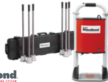
OMG RhinoBond INDUCTION FASTENING SYSTEM

Ein weiterer Vorteil: Durch die Feldbefestigung im Induktionsverfahren wird die Windlast gleichmäßig auf die EPDM-Plane verteilt . So wird die Punktlast je Befestigungsfeld verringert und die Zahl der benötigten Befestigungselemente um bis zu 30% reduziert.