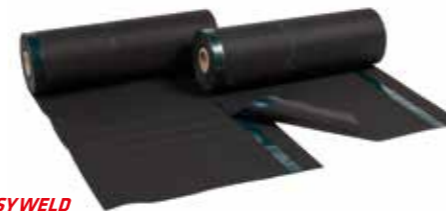
HERTALAN® EASY WELD

Aufgrund der Bahnenbreite und -länge von HERTALAN® EASY WELD lassen sich mit nur einer Nahtverbindung ca. 52 m² Dachfläche abdichten .