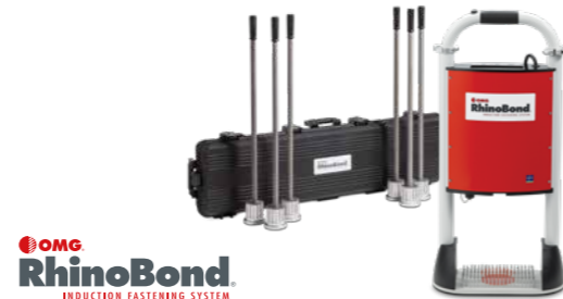
OMG RhinoBond INDUCTION FASTENING SYSTEM

Ein weiterer Vorteil: Durch die Feldbefestigung im Induktionsverfahren wird die Windlast gleichmäßig auf die EPDM-Plane verteilt . So wird die Punktlast je Befestigungsfeld verringert und die Zahl der benötigten Befestigungselemente um bis zu 30% reduziert.