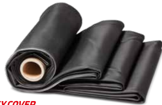
HERTALAN® EASY COVER

HERTALAN® EASY COVER wird ohne offene Flamme verarbeitet, ist wurzelfest, FLL-geprüft sowie gegen UV und Ozon beständig. Das System eignet sich für jedes Flachdach – ob lose verlegt mit Auflast, mechanisch befestigt oder verklebt verlegt .